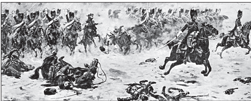
Битва при Прейсиш-Эйлау. Ф. Шоммер