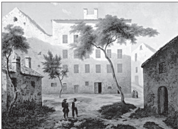
Родина Наполеона. Л.-А. Далиже де Фонтеней