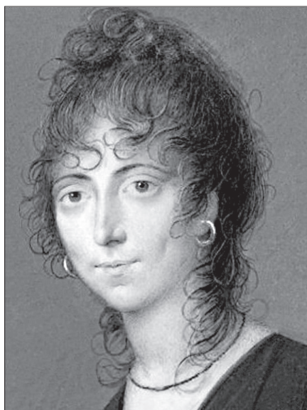
Мария-Летиция Рамолино. Ш.-Г.-А. Буржуа