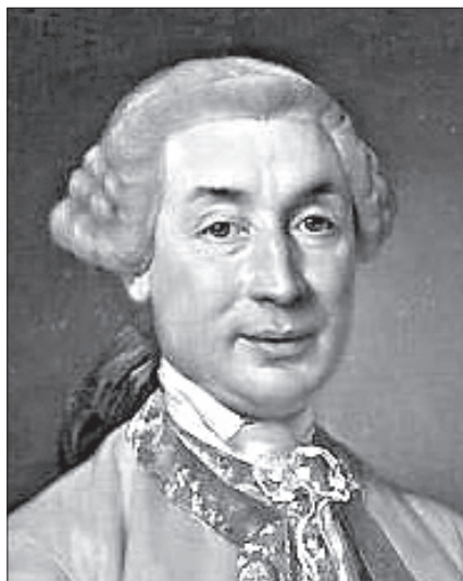
Карло-Мария Бонапарт. Неизвестный художник