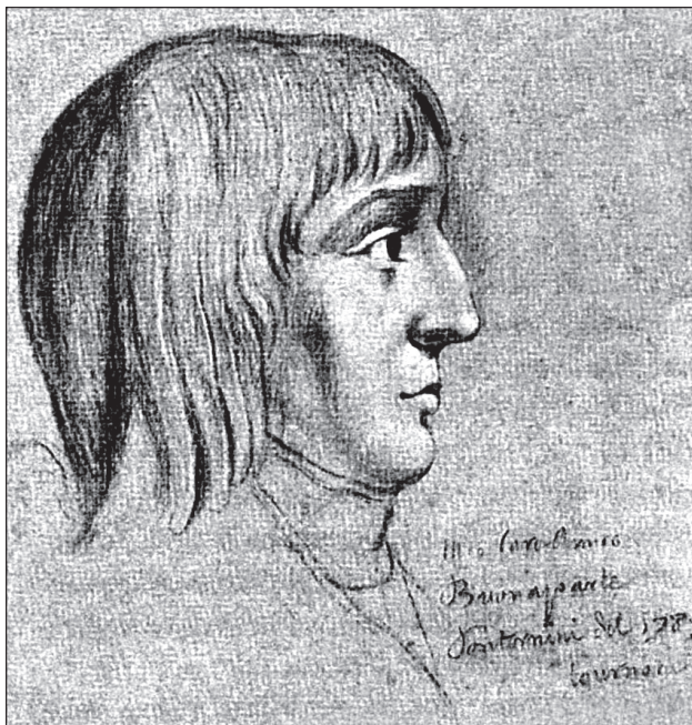
Наполеон в 16 лет. Неизвестный художник