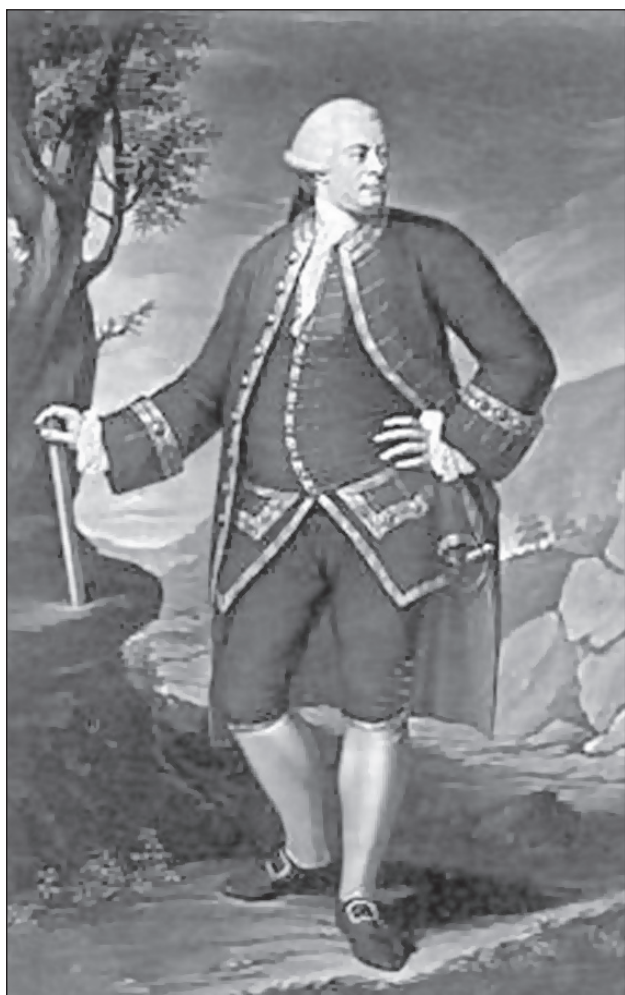
Паскуале Паоли. Г. Бенбридж