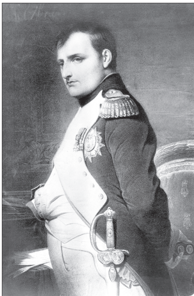
Наполеон Бонапарт. П. Деларош