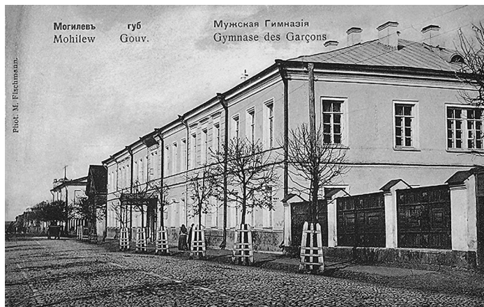
Могилев. Мужская гимназия. Открытка конца XIX – начала XX в.