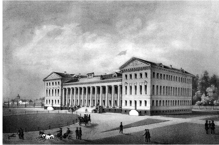
Нежин. Гимназия высших наук (лицей князя Безбородко). Гравюра XIX в.