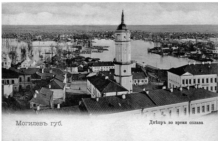
Могилев. Днепр во время сплава. Открытка конца XIX – начала XX в.

мов до 40. Некоторые льют свечи, выделывают кирпич, изразцы и всякую глиняную посуду. Евреи содержат заездные постоялые дворы, перевозки на Днепре, кабаки, корчмы; занимаются торговлею и всякою мелочною промышленностью. Товары в Могилев привозят большей частью из Москвы, Белостока и Царства Польского; заграничные из Пруссии, чрез Юрбургскую таможеню. Годовых ярмарок не бывает: недельные торги по средам, пятницам и воскресеньям. Из Могилева весною по р. Днепру отправляют в Киев и Кременчуг лес, пеньку, постное масло и кожи»*.