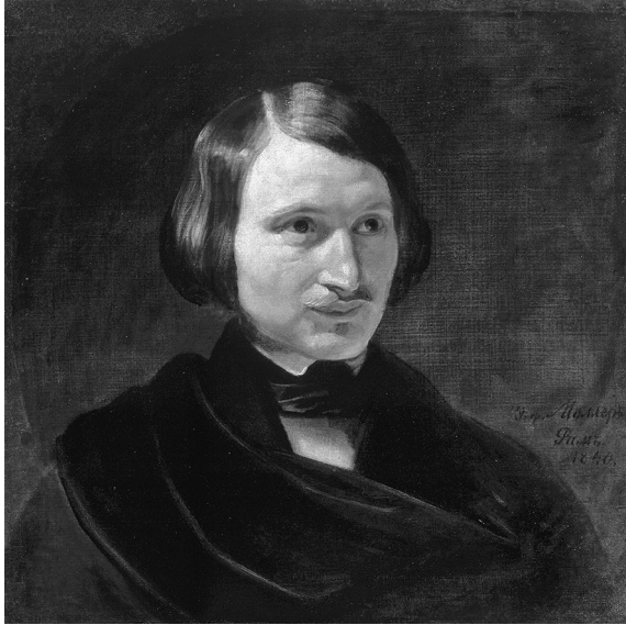
Ф. Моллер. Портрет Н. В. Гоголя. 1840 г.

юноши, с еще не установившимися понятиями находили руководство у людей зрелых умственно и нравственно. В полумраке вековых лип и вязов лицейского сада, где над юношеством витала тень великого Гоголя, сладко мечталось этому юношеству и верилось во все истинное, доброе и прекрасное, укреплялась любовь к тому, противоречия чему им приходилось потом встречать за порогом этого самого сада»*.