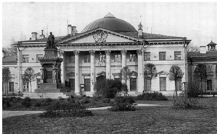
Санкт-Петербург. Военно-медицинская академия. 1914 г.

Первое высшее медицинское учреждение империи призвано было готовить медицинских чиновников разного ранга для военного ведомства. Однако учиться Юрковскому