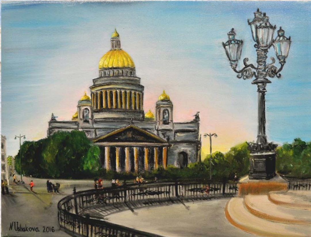
View of St. Isaac's Cathedral. Oil on canvas. 40x50 Вид на Исаакиевский собор. Холст, масло. 40x50