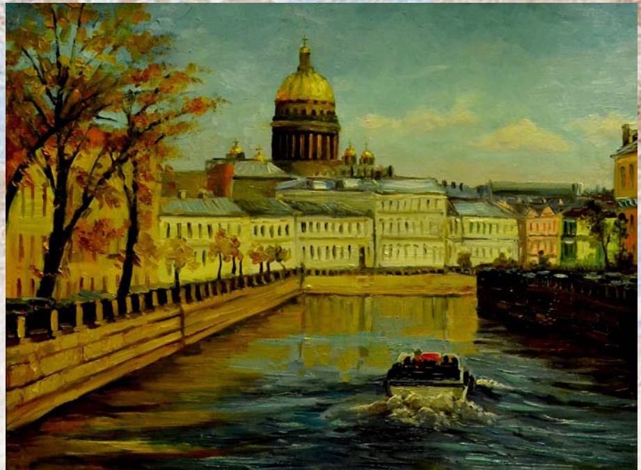
Beloved City. Oil on canvas. 40x50 Любимый город. Холст, масло. 40x50