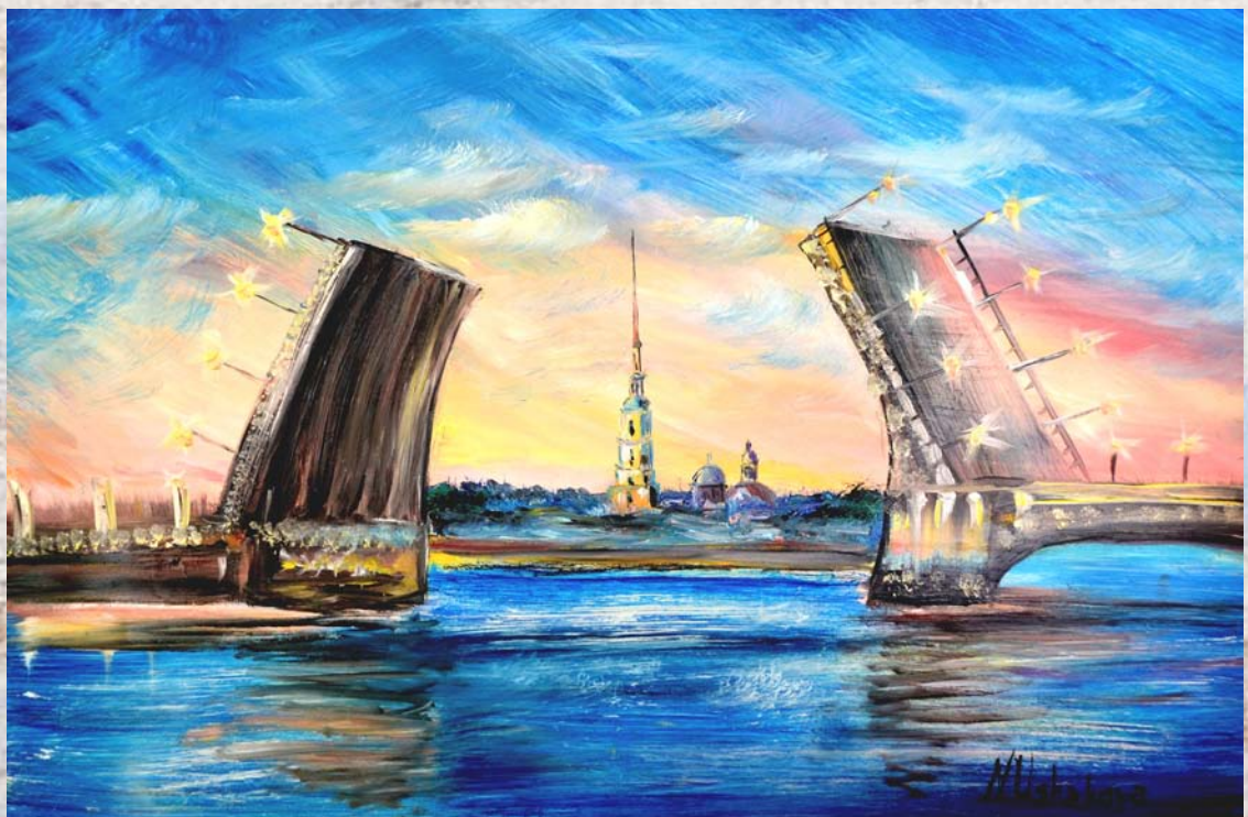
White Nights. Oil on canvas. 30x40 Белые ночи. Холст, масло. 30x40