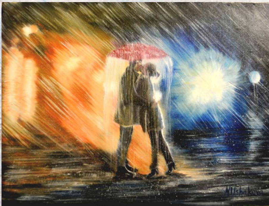
Meeting. Oil on canvas. 30x40 Встреча. Холст, масло. 30x40