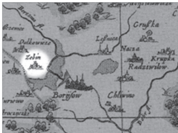
Зембін на Радзівілаўскай карце

Найбольш старое пісьмовае згадванне Зембіна адносіцца да 1526 г., але ёсць прыкметы, што яго гісторыя пачалася значна раней. Краязнаўца Міхась Мачельскі, напрыклад, лічыць, што ў наваколлі былога мястэчка людзі пасяліліся і жылі не адну тысячу год. Старажытнае гарадзішча, якое захавалася на беразе