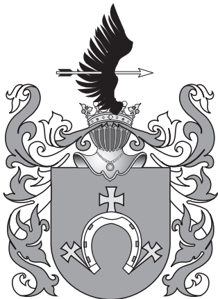
Герб рода Кішкаў

прытока Гайны — р. Зембінкі, з'яўляецца бяспрэчным сведчаннем гэтаму, але даследаванні там яшчэ не праводзіліся.