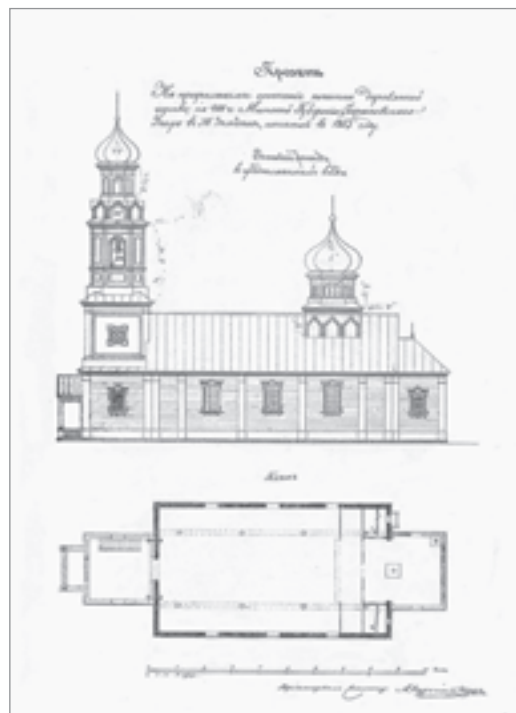
Планы царквы 1853 і 1864 гг., адзіныя, якія захаваліся