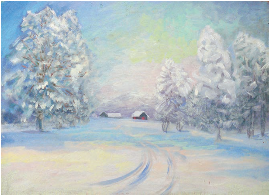
Зіма. Павяла вёскай