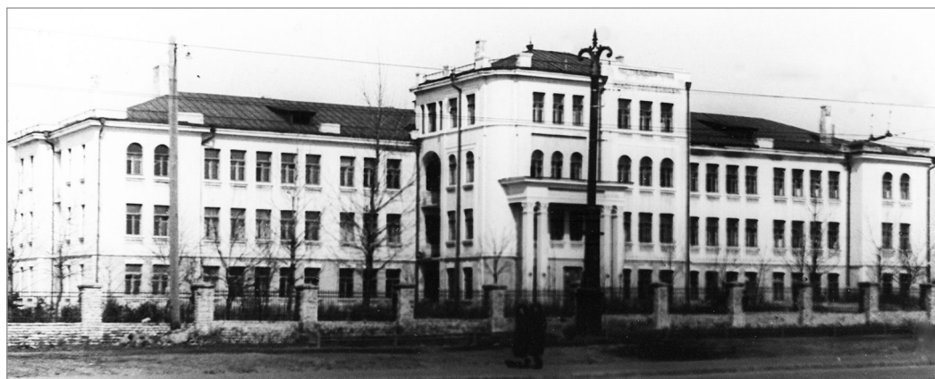
Минский политехникум, весна 1952 г.