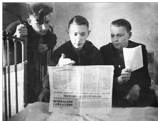
В общежитии, 1953 г.