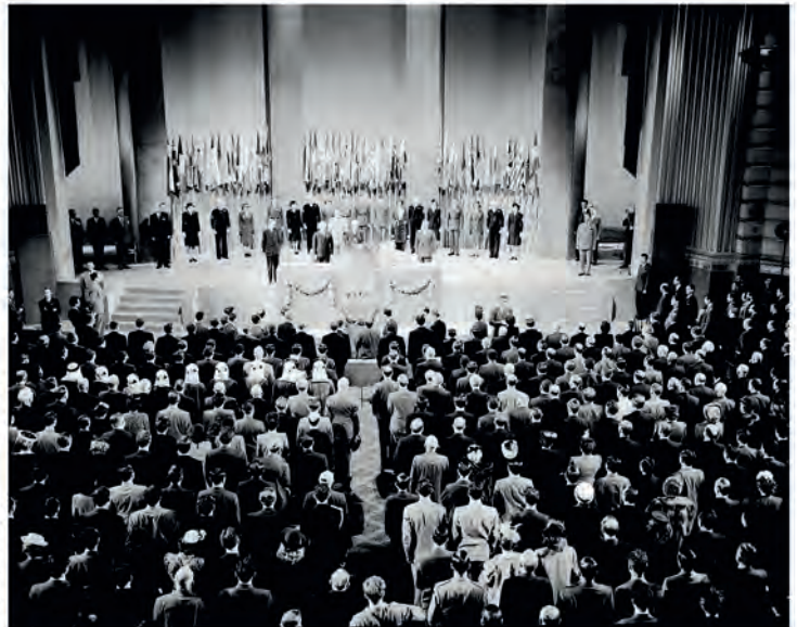
Выступление Э. Стеттиниуса, госсекретаря США, на 16-й сессии Конференции Сан-Франциско, США, 26 июня 1945 г.

В Сан-Франциско собрались делегаты от 50 стран, представлявшие 80% населения земного шара. На повестке дня Конференции стояли предложения, принятые в Думбартон-Оксе, на основе которых делегаты должны были выработать Устав, приемлемый для всех государств.