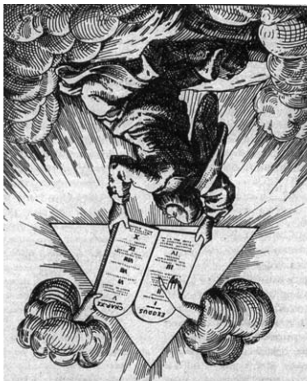
Моисей получает скрижали Заповедей.

До начала XX века, в котором его ждали удивительные события и важные свершения, оставалось меньше полугода. Его судьба была предрешена. Он стал «посвященным» и помнил об этом событии всю свою жизнь, весьма точно схватывая недоступные непосвященным индивидуально-неповторимые сверхнатуральные предметы и явления действительности, воссоздавая их движущимися и красочны-