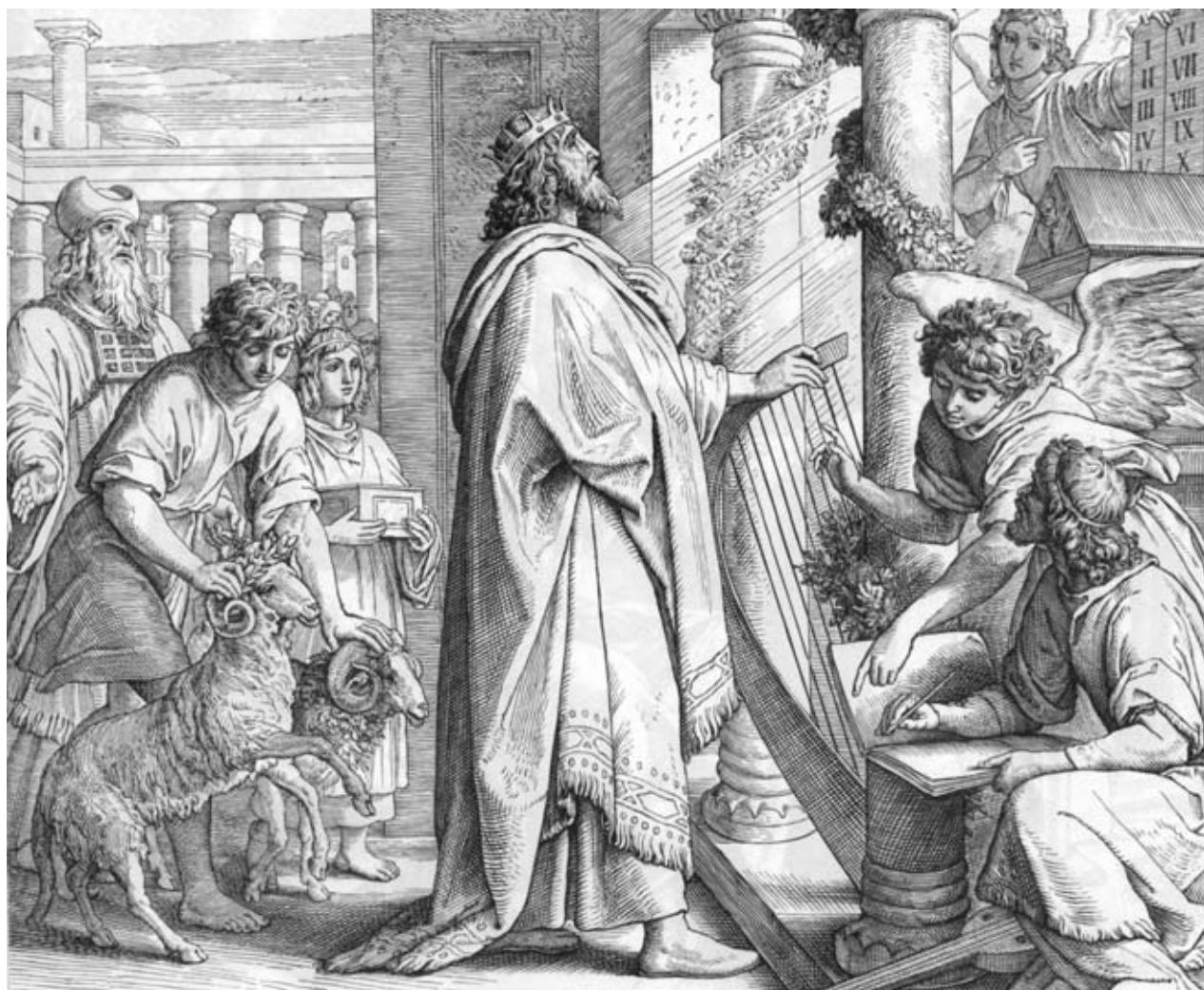
Псалмопевец Давид – поклонение.

Как вечный странник Агасфер, он, будучи юношей, превратился в Адепта.