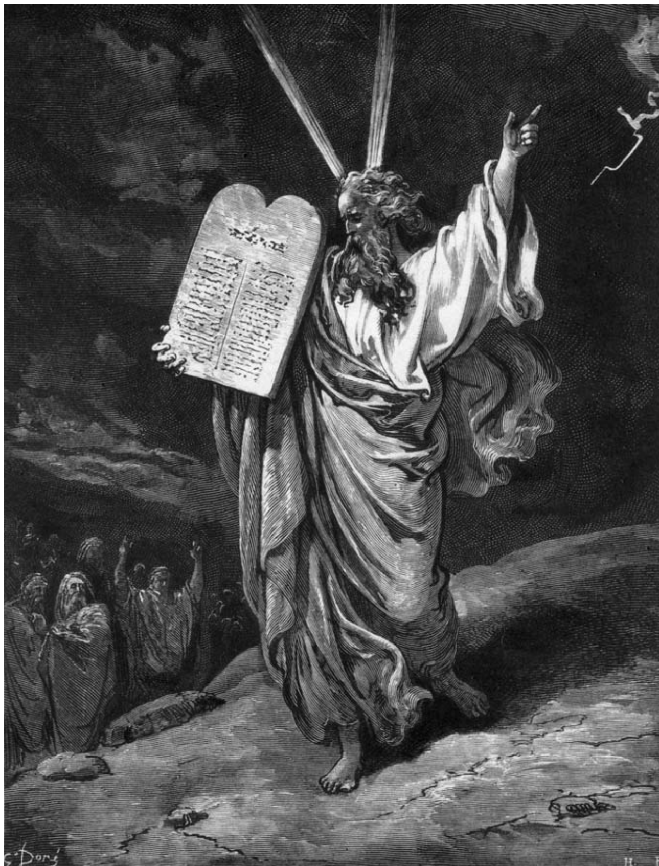
Моисей со скрижалями Закона.