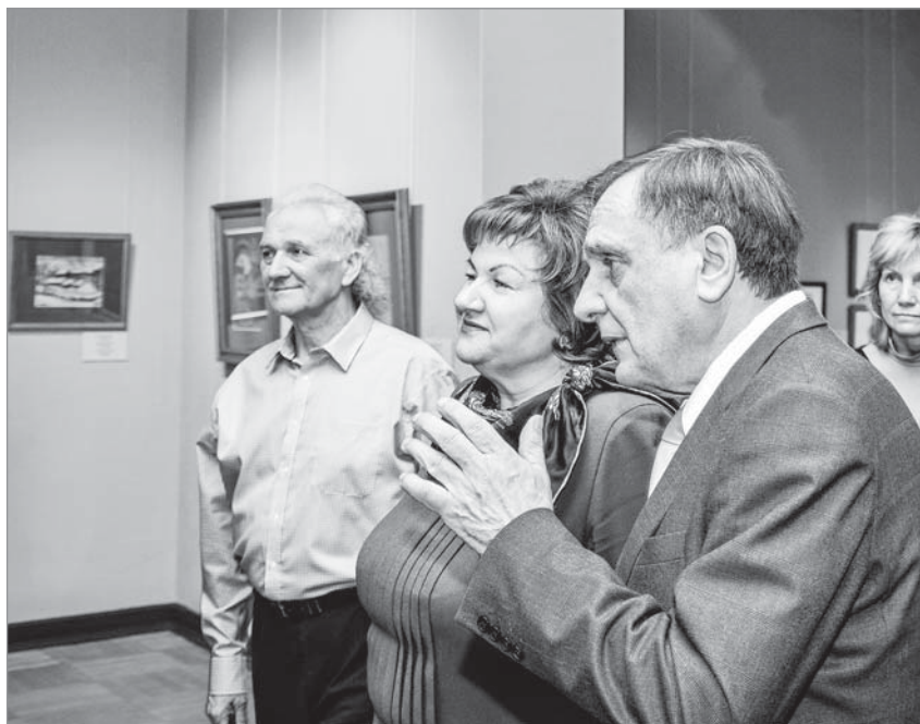
Міністр інфармацыі Рэспублікі Беларусь Лілія Ананіч і Уладзімір Шчасны на выстаўцы «Час і творчасць Льва Бакста» — пасля прэзентацыі.